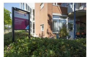
De Zoute Vierer