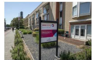
Theo van Doesburg