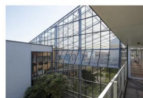
De Gouwe Tuyn