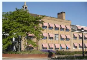
Ter Reede Koudekerkseweg

📍 Zorglocatie, Hospice, Dagbesteding, Behandelcentrum