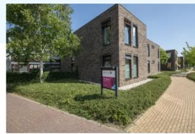
Ter Reede Vondellaan

📍 Zorglocatie, Hospice, Dagbesteding, Behandelcentrum