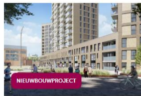
Kop van het Dok