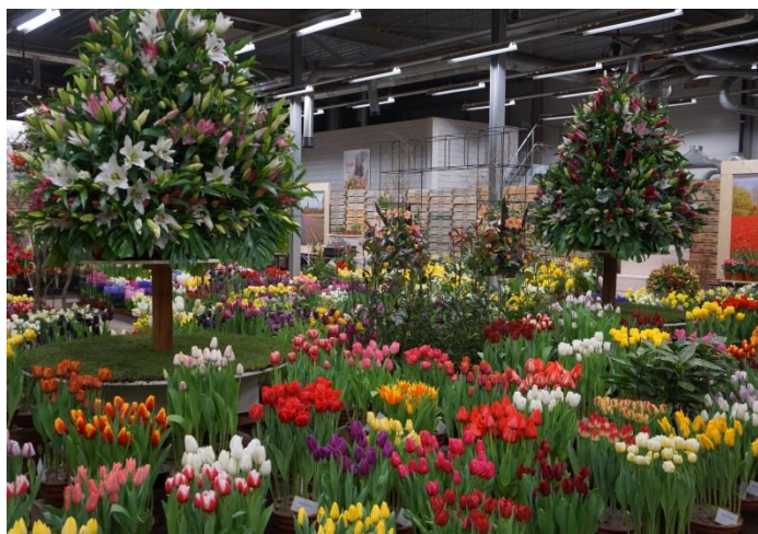
Lenteflora Lisse Zaterdag 16 februari