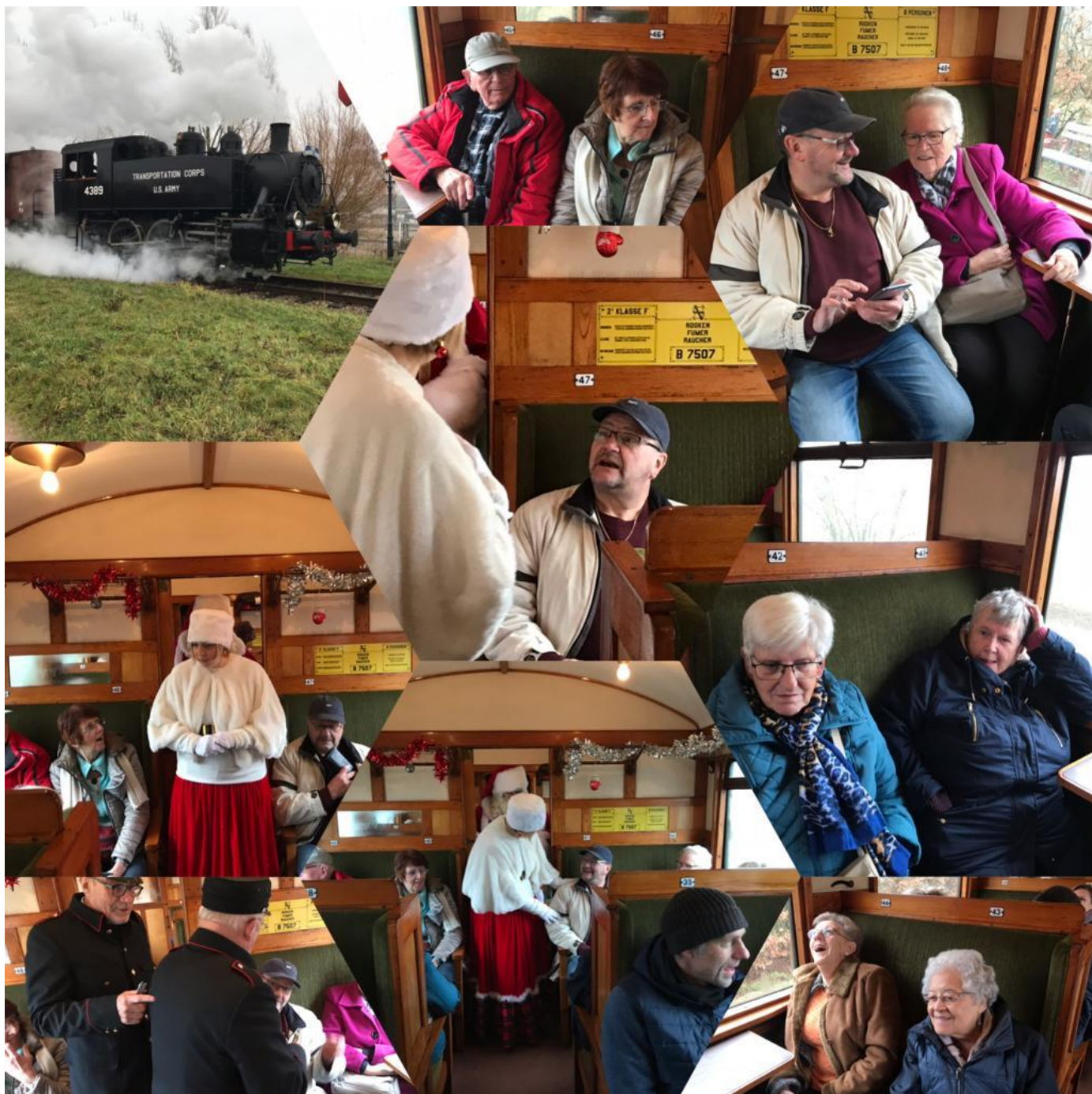
In de kerst stoomtrein Goes Borsele 28december 2018