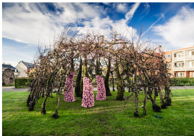
Hoogstraten in Groenten & Fruit Zondag 18 september